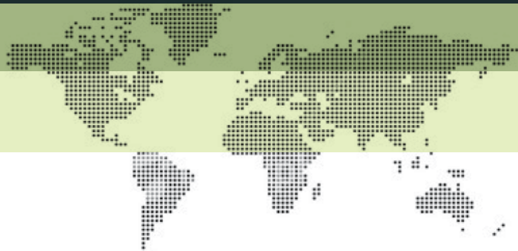
Схема 3 Официална процедура за проучване