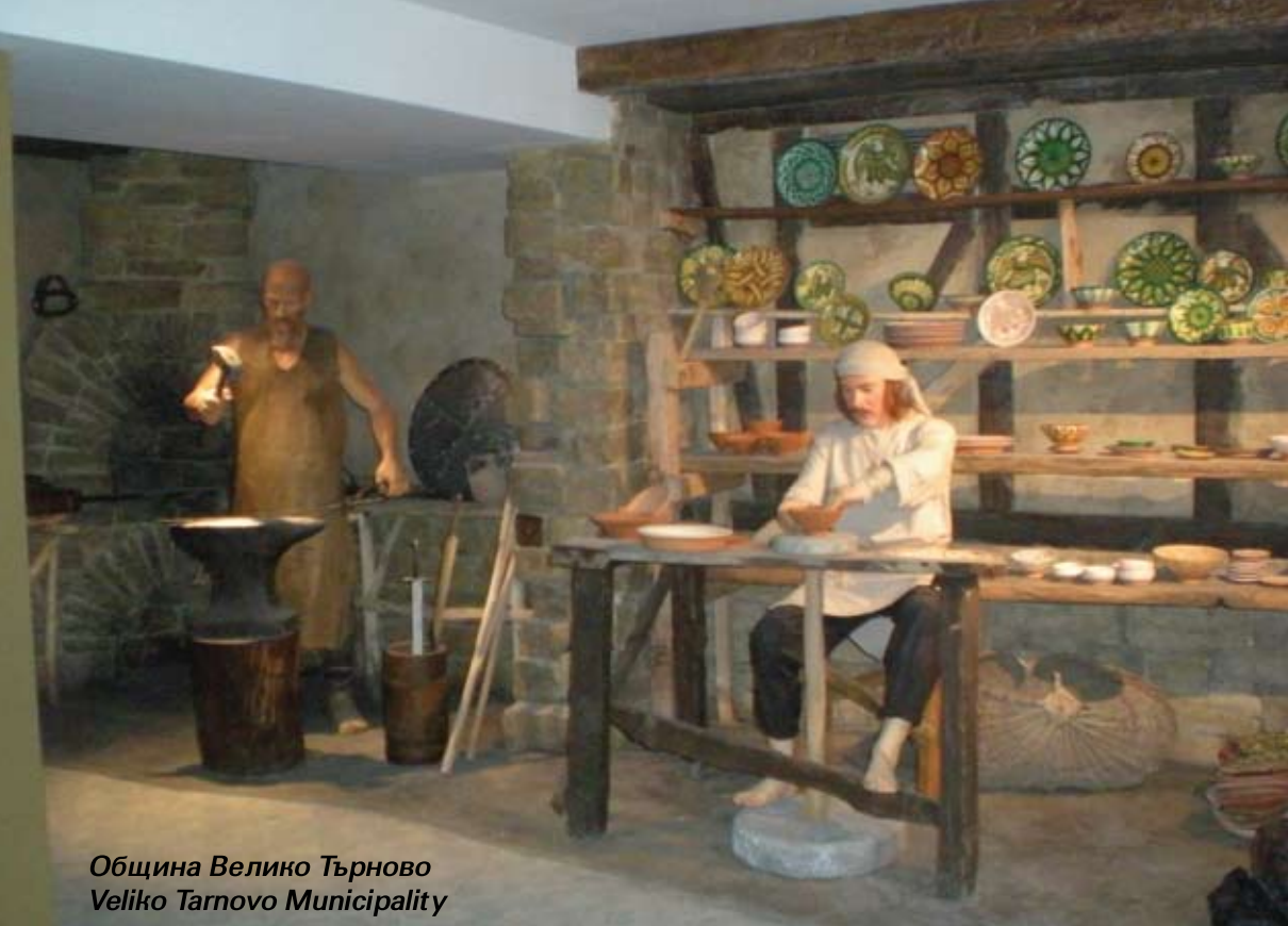
Община Велико Търново Veliko Tarnovo Municipality

BG161PO001/3.1-02/2009/003 Подобряване на туристически атракции и свързаната с тях инфраструктура в община Велико Търново Improvement of the tourist attrac tions and the adjacent infrastruc ture in Veliko Tarnovo Municipality